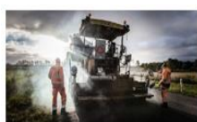
Asfalt og OB