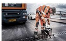
Broer og fræsning